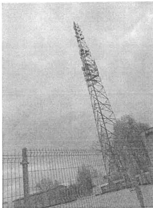
Załącznik nr 1: Widok ogólny instalacji radiokomunikacyjnej.

Koniec sprawozdania. Sprawozdanie zawiera dodatkowo załączniki nr 1 i 2.